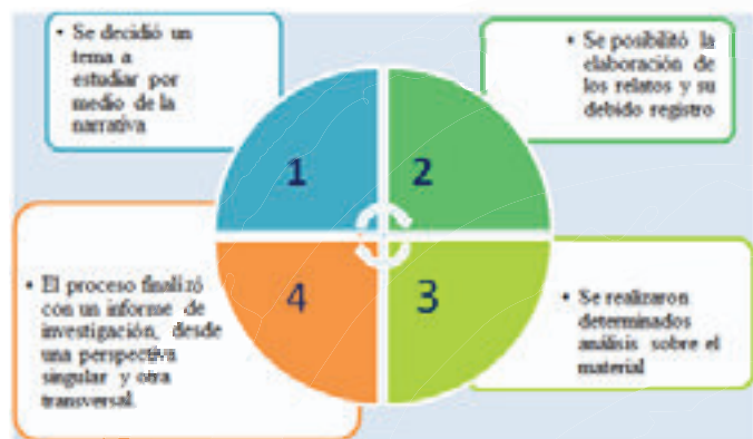
Figura 1. Proceso de investigación

Nota, la gráfica es de elaboración propia, basada en Legrand (1993, p.184)