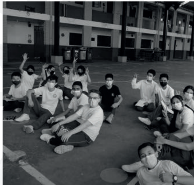
Fotografías de Estudiantes de la IE Diversificado en Sesiones de Educación Física